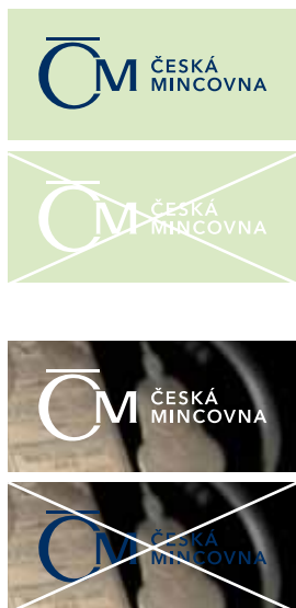
Příklady práce s podkladem